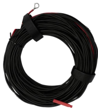
Противага підключається до роз'єму «Земля» розташованому на передній панелі